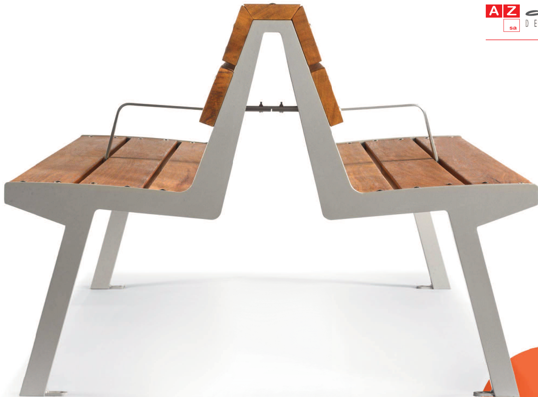
NOALE DOPPIA BENCHES