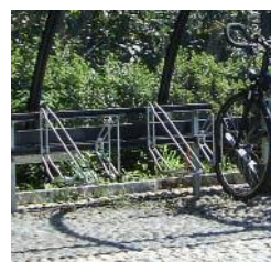
Supports à vélos série D1213