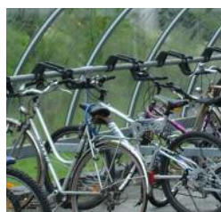
Supports à vélos série 20