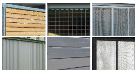
Type de parois latérales et de fond