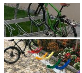
Supports à vélos série H2324 - 26