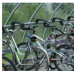
Supports à vélos série 20