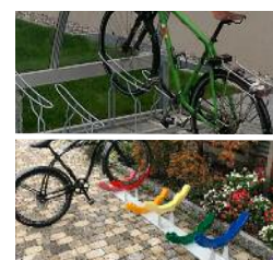
Supports à vélos série H2324 - 26