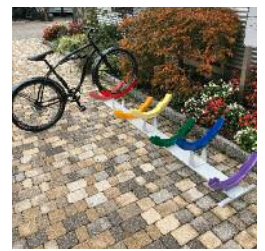
Supports à vélos série 26