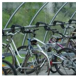
Supports à vélos série 20