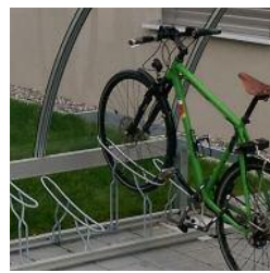
Supports à vélos série H23-24