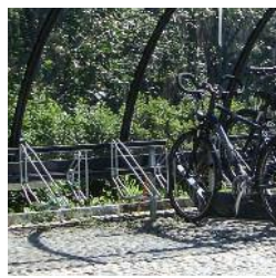
Supports à vélos série D12-13